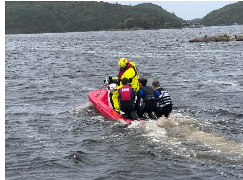
RØFF Kristiansand besøkte Lindesnes Røde Kors Hjelpekorps og fikk prøve seg med vannredningsøvelser.

Samarbeidet med politiet som oppdragsgiver i redningstjenesten er godt. Distriktet har en egen aksjonsledergruppe, og leder av denne er i jevnlig dialog med politiet. Gruppen hadde ved årsskiftet 20 medlemmer med kompetanse i ledelse av søk- og redningsaksjoner. Mot slutten av året igangsatte man sammen med andre organisasjoner et samarbeidsprosjekt med politiet, der man ønsker å benytte frivilliges kompetanse innen ledelse av søk- og redningsaksjoner i enda større grad.