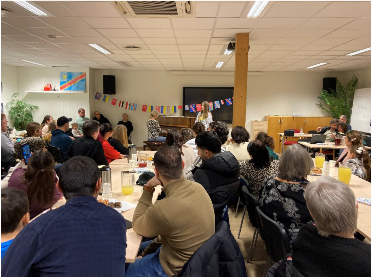
Åpent hus arrangement hos Lyngdal Røde Kors kalt «Velkommen skal du være.»

Lokalforeningene Arendal og Kristiansand tilbyr aktiviteten Flyktingguide for bosatte flyktninger i sin kommune. Aktiviteten sikter mot å bidra til nettverksbygging, norsktrening og bedre kjennskap til norsk kultur og normer, gjennom å koble en flyktning som er blitt bosatt med en frivillige basert på felles interesser, alder og livssituasjon.