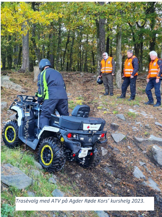
Trasèvalg med ATV på Agder Røde Kors' kurshelg 2023.

En av distriktsrådets prioriteringer har vært å legge til rette for kompetanseheving i hjelpekorpsene i Agder gjennom økonomisk støtte til, og/eller praktisk gjennomføring av kurs. Agder Røde Kors arrangerte landets første fullverdige AFØR kurs (avansert førstehjelp), dette var et distriktsamarbeid med Rogaland. På distriktets kurshelg i oktober ble det arrangert ferdighetstreninger innen