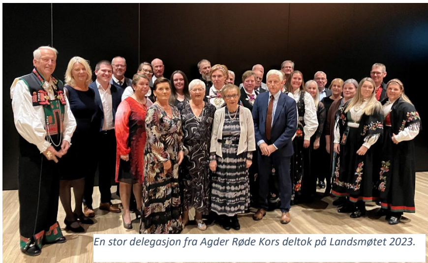
En stor delegasjon fra Agder Røde Kors deltok på Landsmøtet 2023.

Distriktsstyret mener årsregnskapet gir et riktig bilde av foreningens eiendeler, gjeld, finansielle stilling og resultat. Årsregnskapet viser et positivt aktivitetsresultat på kr 4 227 516 som overføres til egenkapitalen. Egenkapitalen pr 31.12.2023 er på kr 23 470 453.