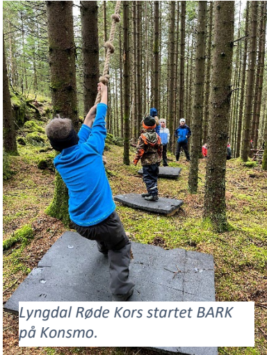
Lyngdal Røde Kors startet BARK på Konsmo.

Agder Røde Kors jobber for å skape trygge oppvekstvilkår for alle. Gode fritidstilbud og sosiale møteplasser er et av de sterkeste virkemidlene vi har for å inkludere barn og unge. Gjennom aktiviteter legger vi til rette for at barn og unge kan danne nettverk, oppleve mestring, samhold og fellesskap.