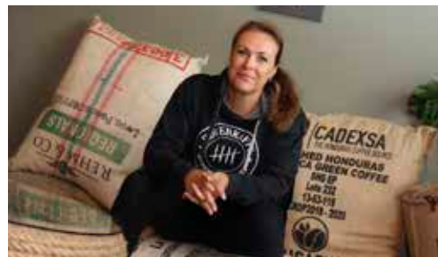
Frihet i en kaffekopp s. 8