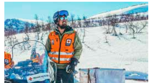
Når alarmen går s. 10