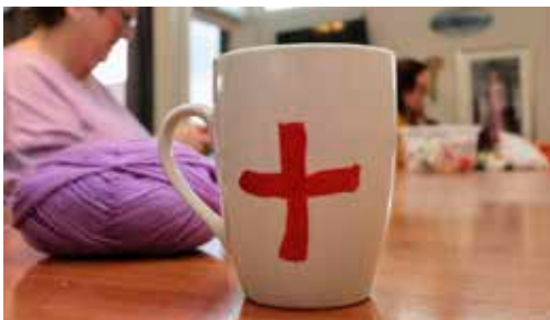
Bli med på strikkeklubb! s. 4