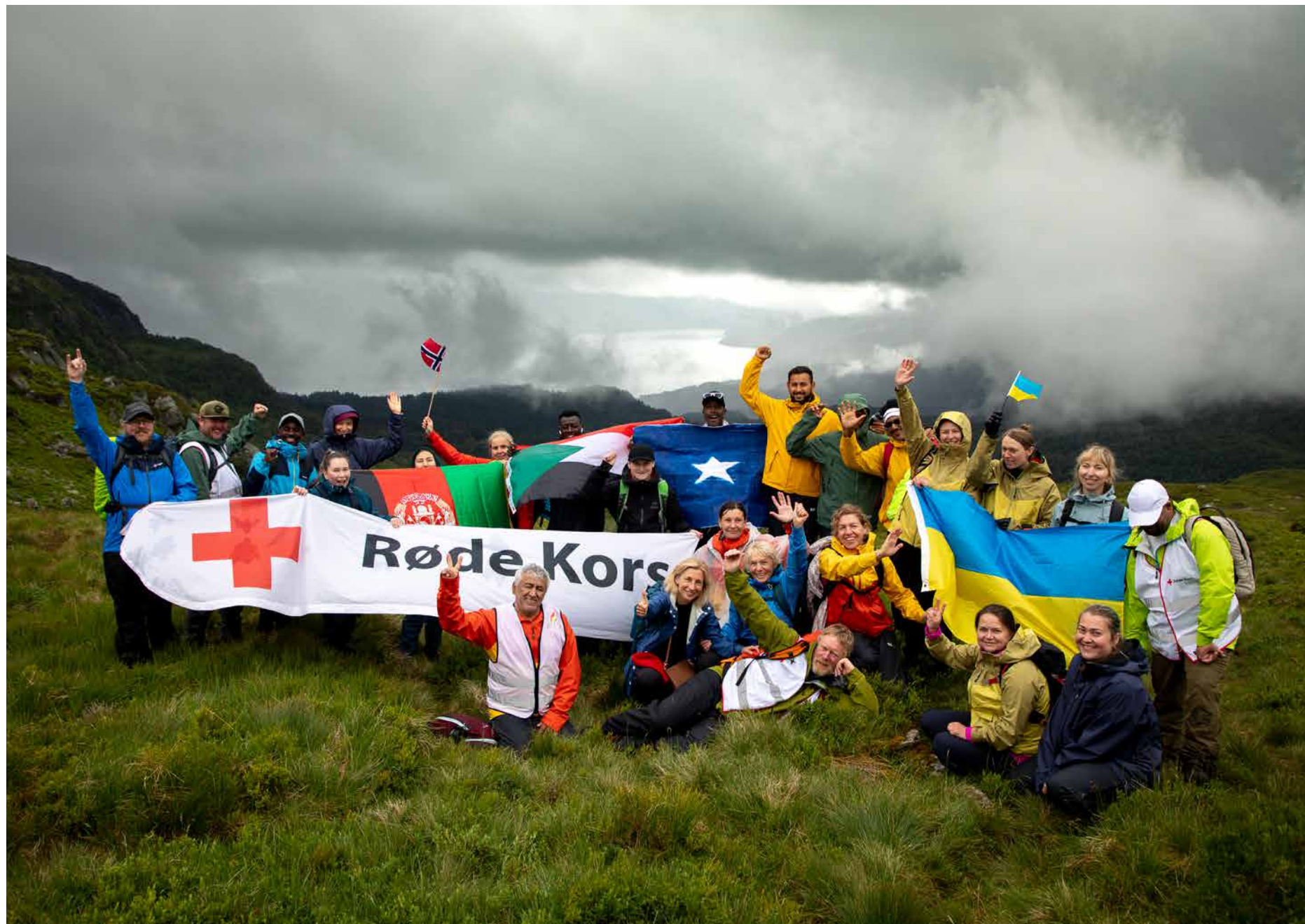
Årets Til Topps-tur samlet åtte nasjonaliteter på tur i Saudafjellene.

30 deltagere fra åtte ulike nasjoner koste seg på tur i Sauda.