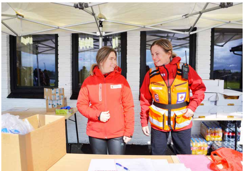
Hjelpekorpsset er på plass, som seg hør og bør på et idrettsarrangement. De melder om få skader, men mye glede.