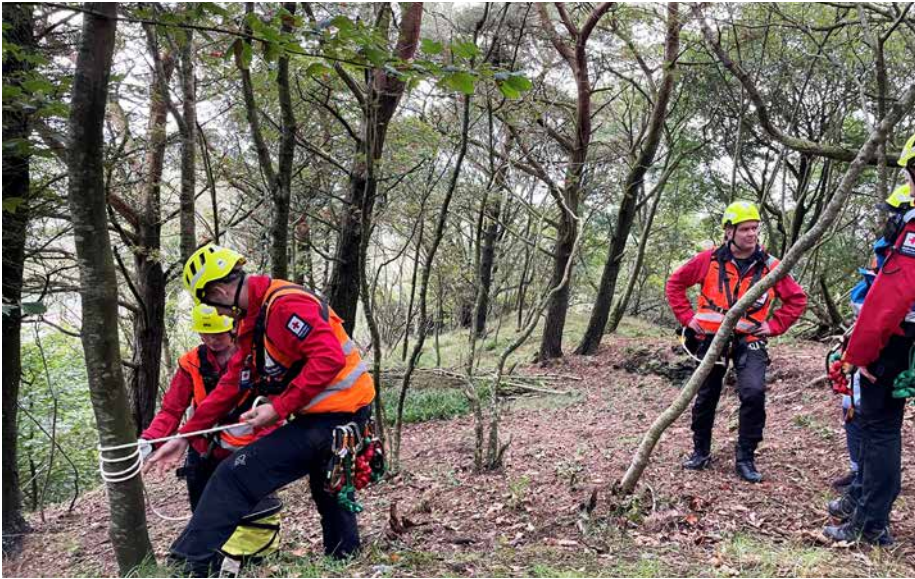
Gelendertau settes. Bak tauet skal ingen gå uten å være sikret med tau.