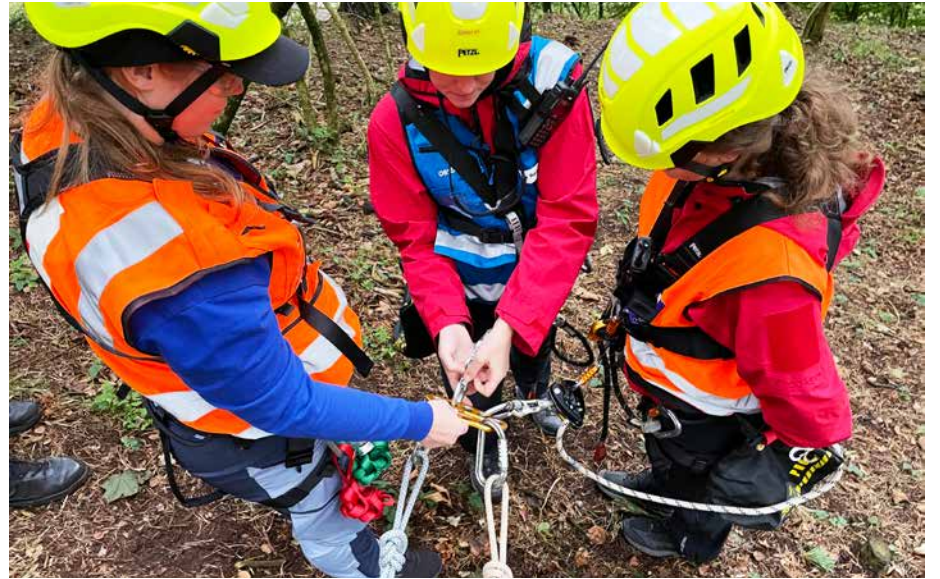
Sikringsplaten, hvor flere klatrere kan koble seg på, kontrolleres.