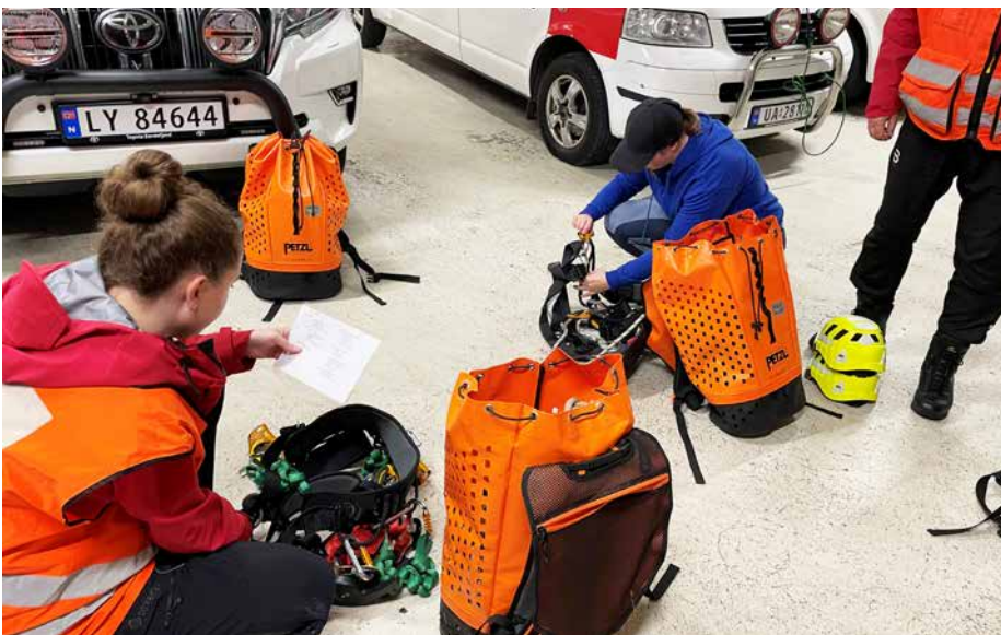
System er viktig, og treningen er ikke ferdig før tau, kabiner, hjelmer og annet klatreutstyr er plassert der det hører hjemme.