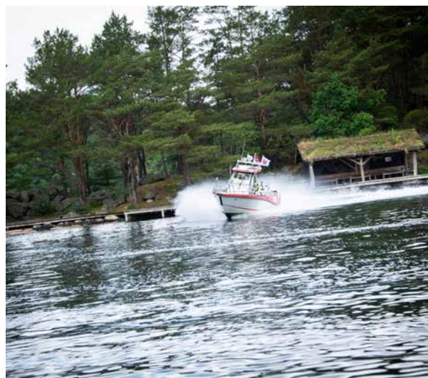
Redningsbåten Triton dekker store avstander til sjøs, og får stadig flere oppdrag.