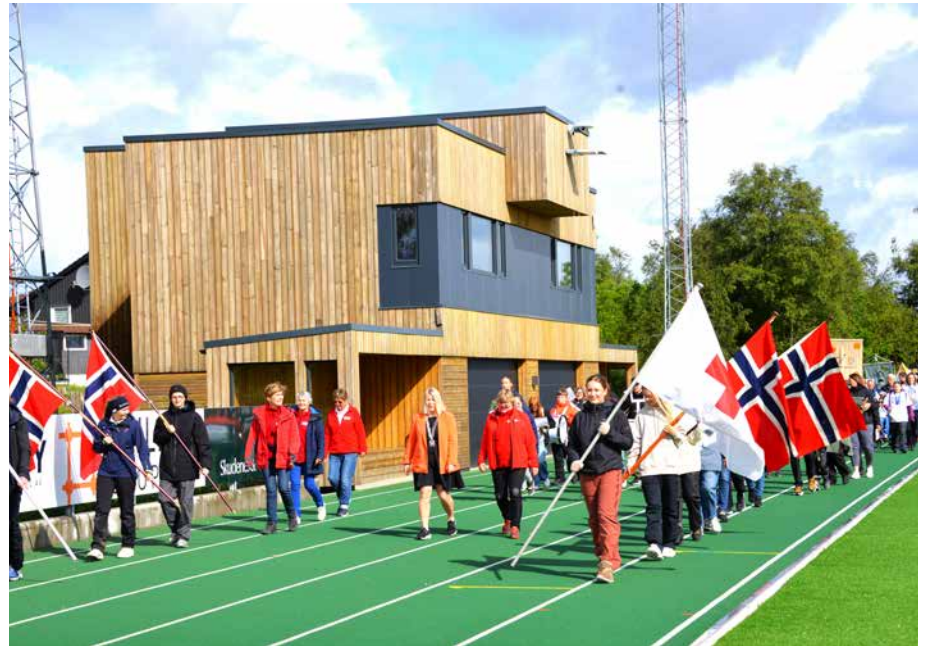
Innmarsjen til Karmøylekene er et stort arrangement verdig med flaggborg, korps og faner. Etter en runde rundt Åsebøen stadion var deltagerne klare til å konkurrere i ulike grener.