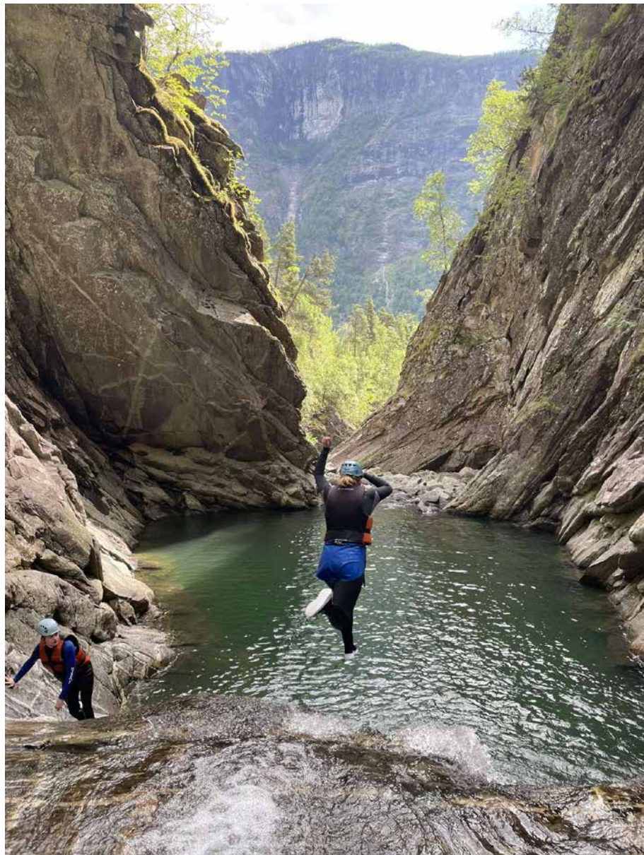
Hopp i det! RØFF-ere fra hele landet fikk utfordre seg selv under sommerens camp.

RØFF (Røde Kors Friluftsliv og Førstehjelp) er et fritidstilbud for ungdommer mellom 13 og 17 år. Annethvert år samles RØFF-ere fra hele landet til leir, og i år var det Luster Røde Kors sammen med Sogn og Fjordane Røde Kors som inviterte til RØFF-camp.